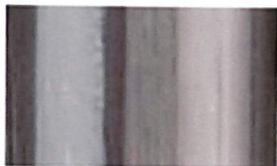
Technoline (Clear) 0325