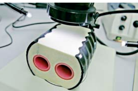
Testowanie i monitorowanie