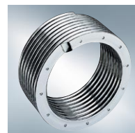
Powierzchnia grzewcza Inox-Radial z wysokojakościowej stali szlachetnej