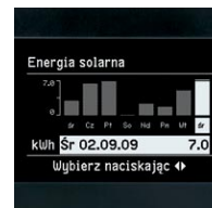
Obsługiwany dialogowo cyfrowy regulator centrali grzewczej