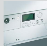
Cyfrowy regulator pogodowy Vototronic 200